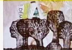
Polona Boštjančič, 7. r Moja drevesa, 2016, linorez, 20,8 x 29,4 cm OŠ PRESTRANJEK Mentorica: Urška Tušar