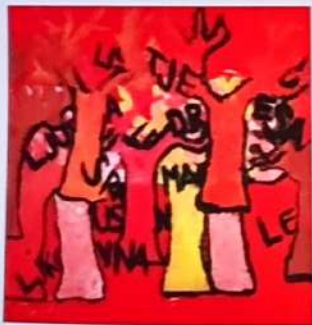
Armeda Korjenčić, 7. r Biserje med drevesi, 2015, tempera na tekstilu OŠ ISTRSKEGA COVEDA GRACIŠČE Mentor: Vaja Nanut