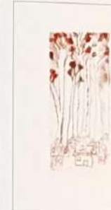
Aljaž Velikonja, 6. r Vas pod krošnjami, 2015, suha igla OŠ OTUČA Mentorica: Ana Tržič