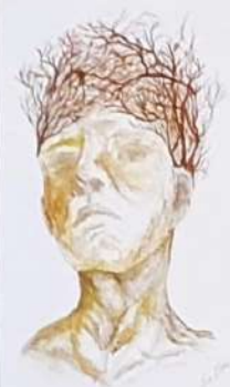
Lara Marc, 9. r Človek drevo, 2015, mešana tehnika OŠ STURJE AIDOVŠČINA Mentorica: Bojan Bole, Tea Cirk Sirta