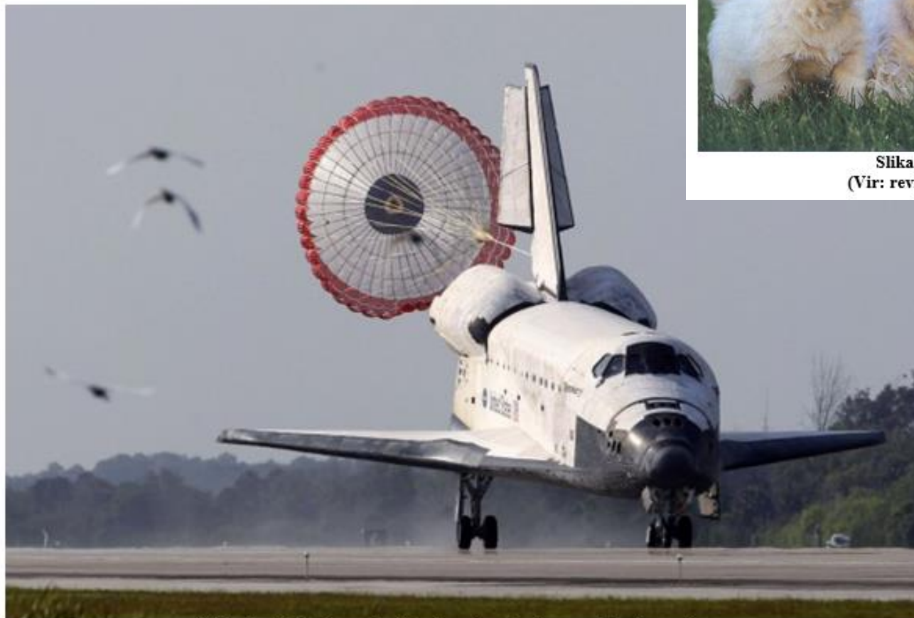
Slika 1: Orbitalno plovilo ob pristajanju na vzletni stezi