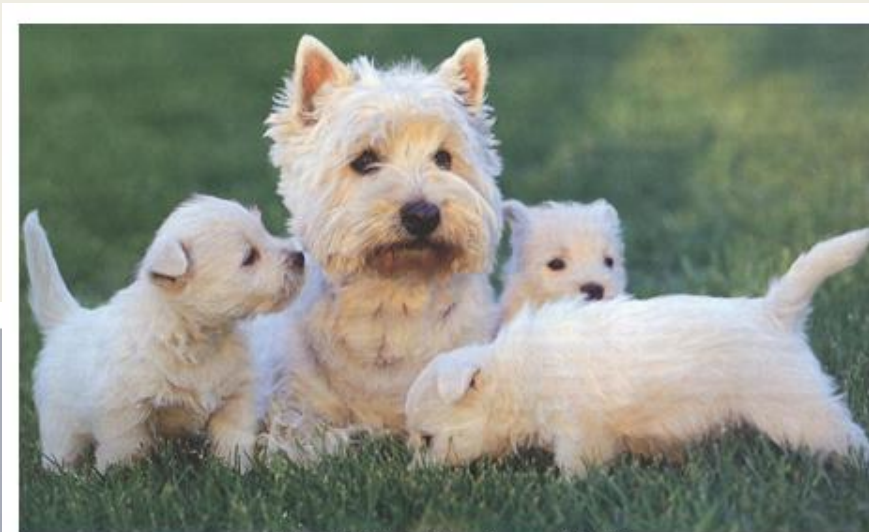
Slika 1: Višavski terier z mladički