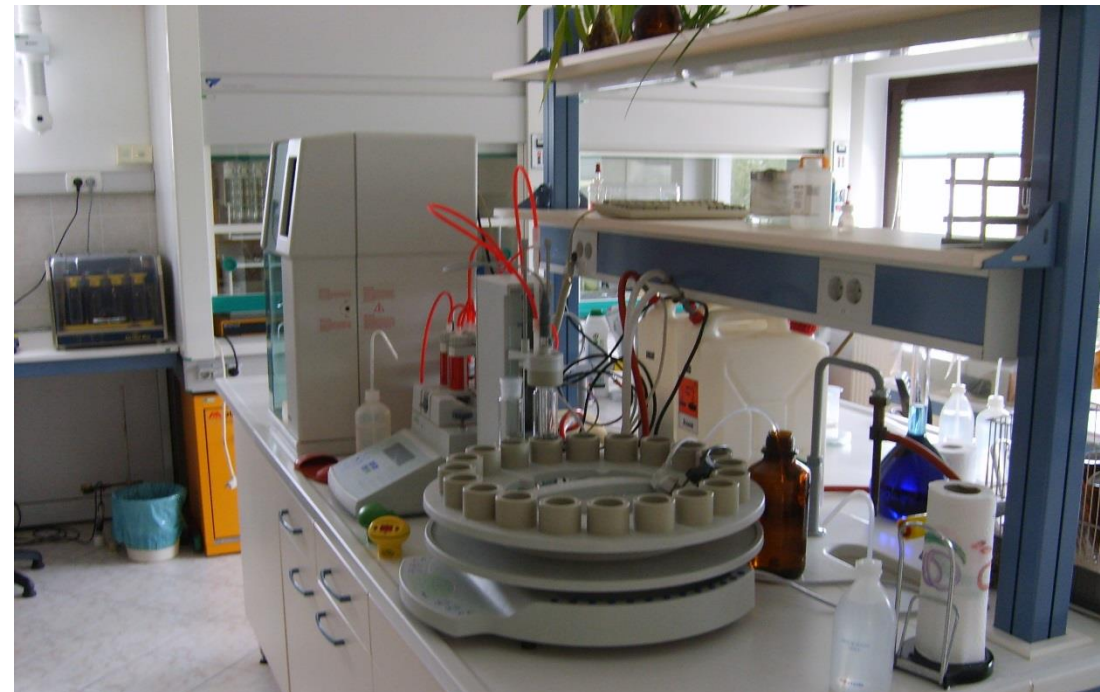
LABORATORIJ na čistilni napravi Ajdovščina

Odpadna voda se na dotoku in iztoku vzorči 24 ur na dan in se dnevno analizira v laboratoriju čistilne naprave. Enkrat mesečno izvaja uradne meritve zunanji laboratorij.