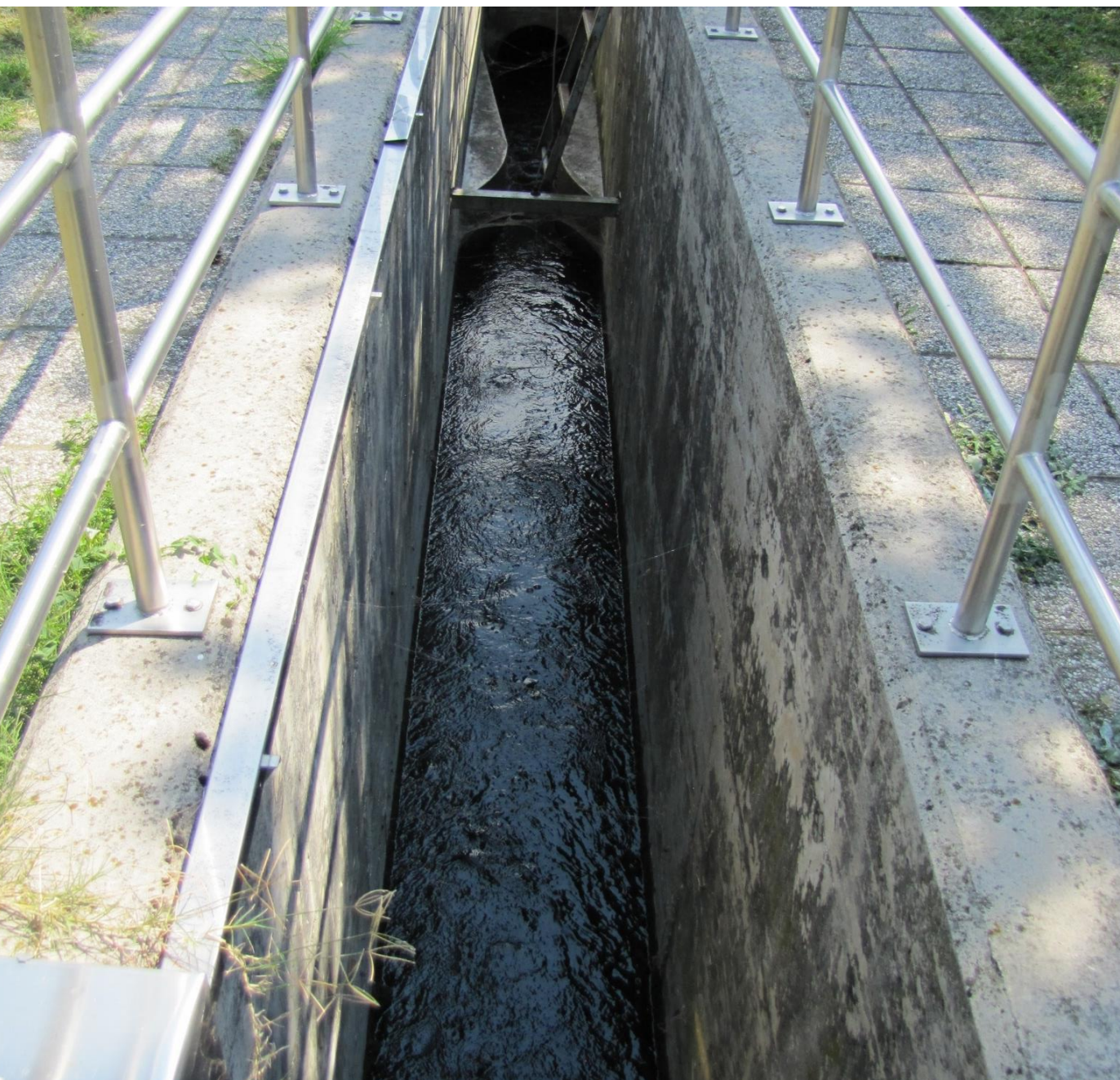
IZTOK prečiščene vode čistilne naprave Ajdovščina